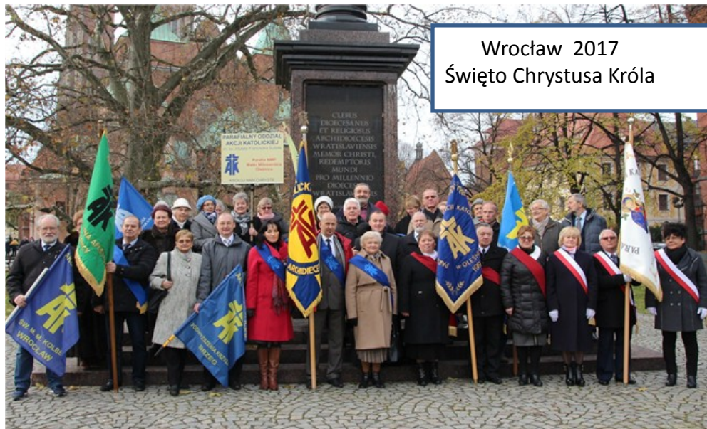
Wrocław 2017 Święto Chrystusa Króla