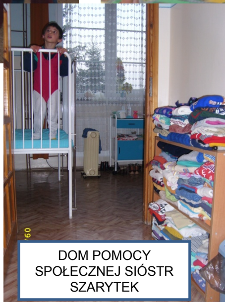
DOM POMOCY SPOŁECZNEJ SIÓSTR SZARYTEK