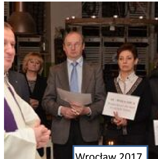
Wrocław 2017 Miser Art