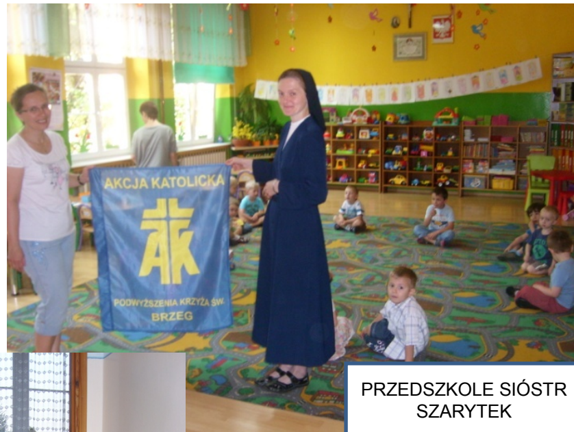
PRZEDSZKOLE SIÓSTR SZARYTEK