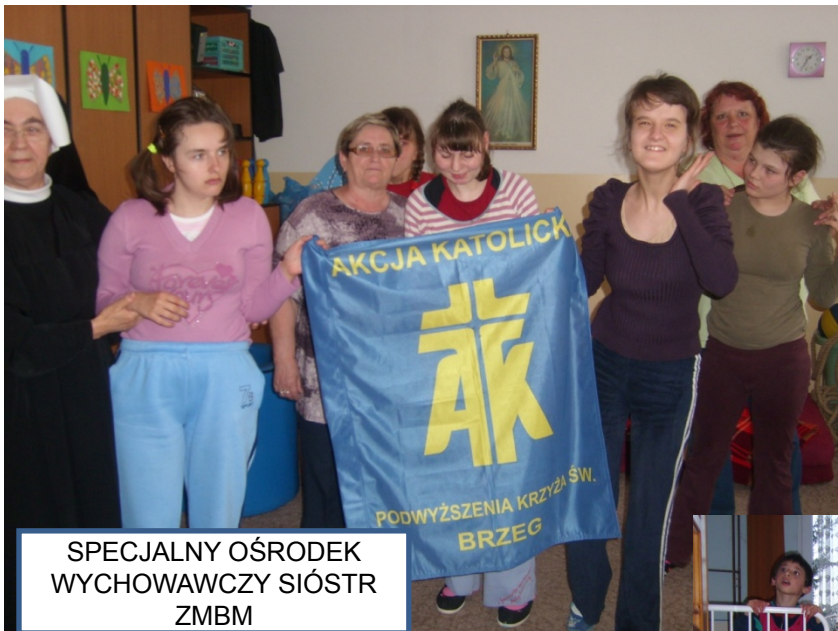
SPECJALNY OŚRODEK WYCHOWAWCZY SIÓSTR ZMBM